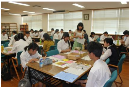
昨夏の宇部中央高校での 長南地区読書会の様子

宇部、山陽小野田市内の各校の高校生が お菓子や飲み物を取りながら、 読後感を話し合う。